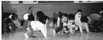
クマさん歩きをする港保育園の園児たち

「全身運動することによって、前頭前野が活性化し、感情をコントロールする力、注意力や抑制力や判断力(が)よりうまく働くようになる」のです。 また、1日の活動量とコミュニケーション量(会話数)は、比列することも分かっています。身体を動かす遊