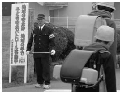
八条校区交通安全自治会による登下校の見守り活動

また、学校では、「子どもの安全を守る学校安全対策会議」を設置し、通学路の安全点検や、防犯訓練、安全マップの作成など、学校と地域・家庭が一体となった取り組みを