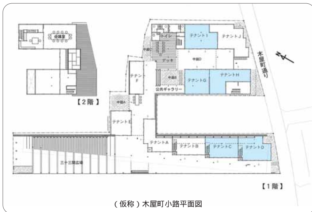
(仮称)木屋町小路平面図

01城崎町湯島1062 県立城崎大会議館内) ☎ 32・4411 Fax 32・4171 メールアドレス Kinosho@gold.ocn.ne.jp