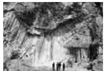
▲日本の地質百選の玄武洞公園

エリアは、京丹後市の経ヶ岬と鳥取市白兔海岸の間で、本市の3市3町の範囲です。日和山、玄武洞公園、神鍋高原などの主な地質遺産があります。 ジオパークは、地質遺産を保護保全するとともに、このプロジェクトを持続・継続させるために、次のことなどが求められています。