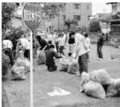
▲クリーン作戦 (小田井)

● 適正処理に協力ください 不法投棄されたごみの中には、通常の家庭ごみで収集できるごみや、清掃センターで処理できるごみも多く見受けられます。 ごみの処理については、各家庭に配布している「家庭ごみの分別とりサイクルの手引き」で確認してください。 なお、出し方が分からない時は、生活環境課に電話などで確認の上、適正に処理してください。