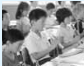
▲合同学習でリコーダー合奏をする児童たち

僕がみんなを見てびっくりしたことは、リコーダーと歌です。リコーダーは、間違う人が少なく、音がよく響いていました。