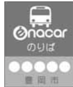
▲このバス停が目印