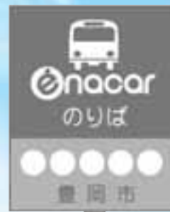
▲このバス停が目印