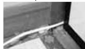
▲電気コードは挟まない

電気製品のコードや延長コードが火災の原因となることがあります。コードを踏みつけたり、ねじれや折れ曲がった状態で使用していると、中の線が部分的に切れて発熱やショートを起こし火災になります。次のことに注意して電気コード火災を防ぎましょう。