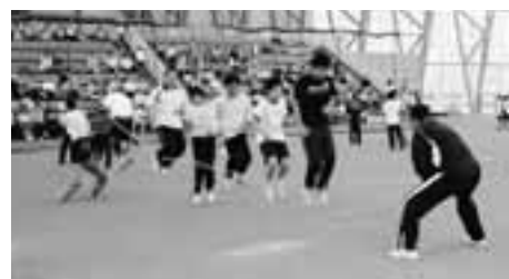
▲「スポーツクラブ21ひょうご」とよおか交流スポーツ大会の長なわとび