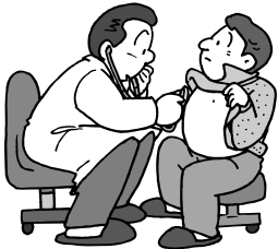
《登録健診機関》(病院・診療所別・地域別医療機関名50音順)

市内では、下表の医療機関が登録健診機関となっております。受診については、各医療機関に問い合わせください。