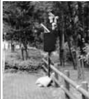
▲不法投棄監視カメラ