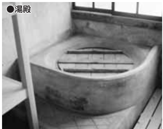
●湯殿 ▲役者などが顔や体に付いた化粧や墨を落とす風呂場のことで、永楽館では、下手側奥の1階にあります