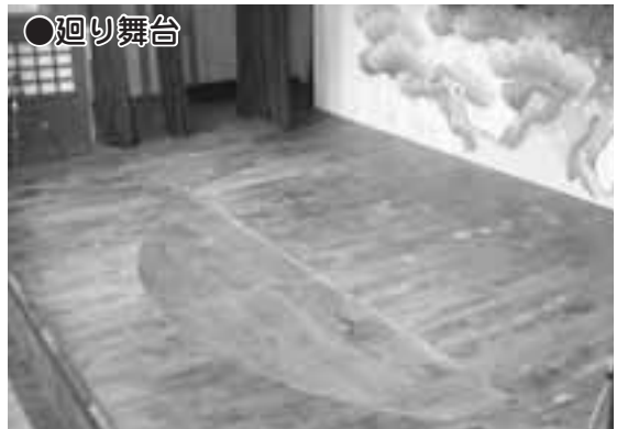
●廻り舞台 ▲舞台中央にある大きな円のこ。舞台装置や役者を乗せたまま回転させる装置