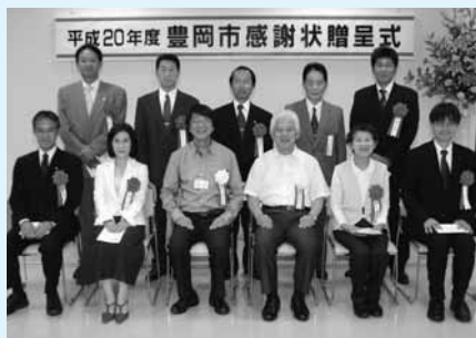
贈呈式後の記念撮影