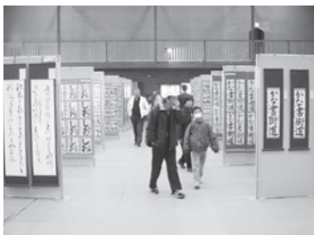
▲昨年の様子(中竹野ふるさと館)

▽期間 11月21日(土)～23日 ・ 一般の部の入賞作品、招待作品、賛助作品を展示 ・ 中竹野ふるさと館(中竹野小学校体育館(竹野町轟)) ・ 一般の部の入選作品、高校生部の入賞・入選作品、小・中学生の部の入賞・入選作品、協賛作品を展示