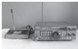
▲無線機・マイクセット