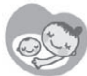
マタニティマーク

※妊産婦さんに思いやりをもちましようとして提唱しているマークです。このマークをつけている妊産婦さんを見かけたら、皆さんからの思いやりのある気遣いをお願いします。