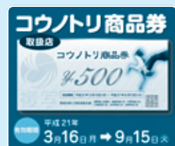
▲このステッカーのお店で使用できます