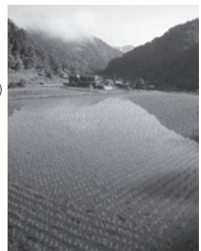
▲「山霧残る朝の田」 (竹野町須野谷)