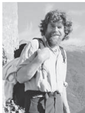
ラインホルト・メスナー (イタリア)