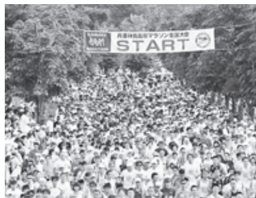
▲昨年の大会の様子

このマラソン大会は、ランナーだけでなく、応援に訪れた方々にも楽しんでいただける大会として親しまれています。皆さんも、ぜひ、神鍋高原へお越しいただき、楽しい休日をお過ごしください。