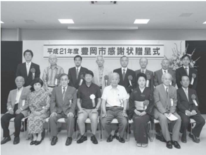
贈呈式の後の記念撮影