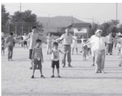
▲昨年行われた中筋地区「三代 早起きラジオ体操」

ラジオ体操を通じて、地域 の子どもたちと顔見知りにな り、相互に声掛けをすると、 子どもは見守られているとい う安心感や安堵感を持ち、地 域に対する親近感や帰属意識 を抱くようになり、問題行動 の芽を摘むことにもつながり