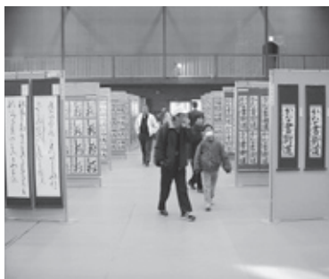
▲第8回展では全国29都道府県から4,001点の応募があった