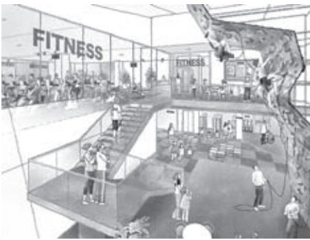
▲エントランスイメージ図