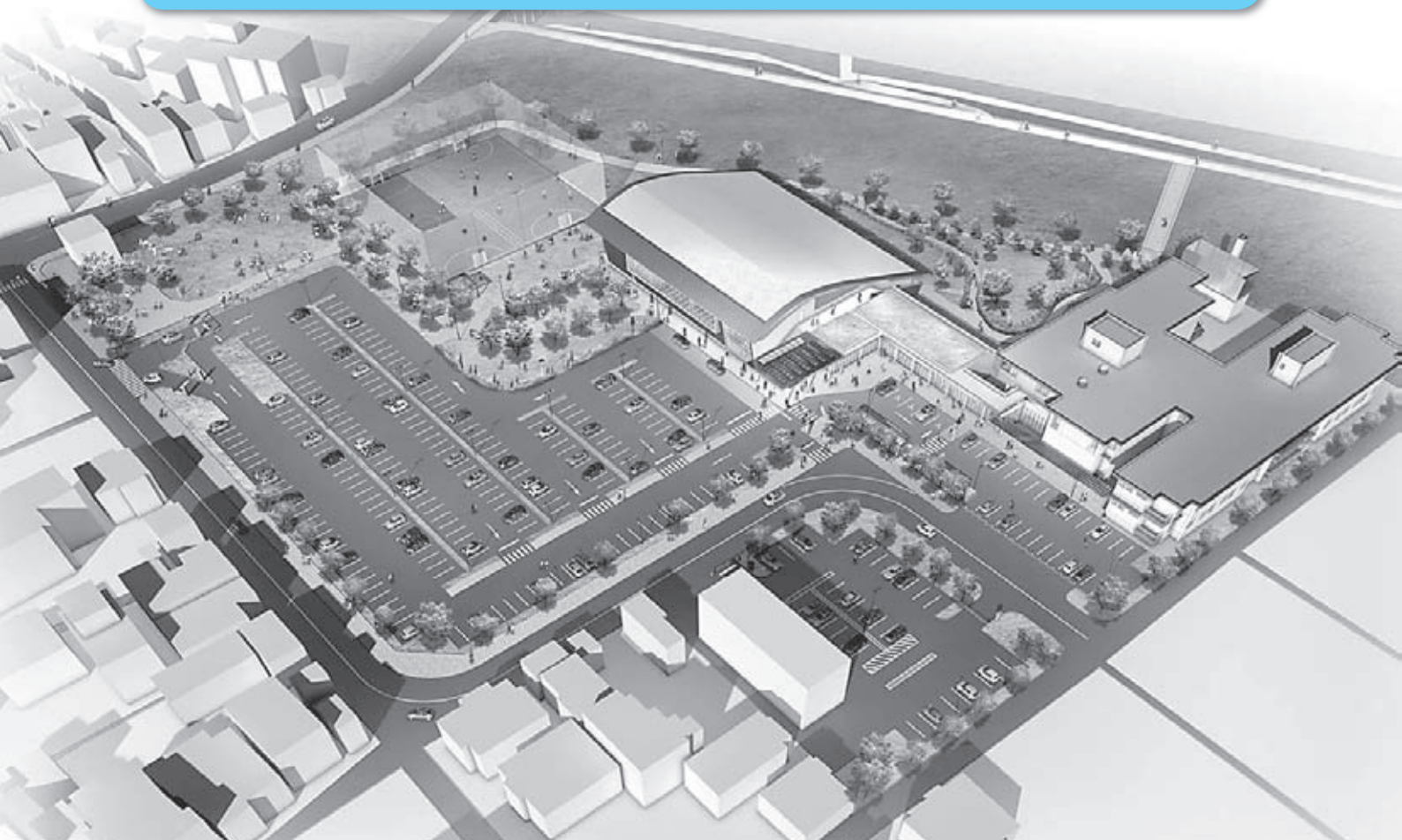
▲総合健康ゾーンイメージ図

市では、公立豊岡病院の跡地(立野町)を有効活用するとともに、市民が健康でいきいきと暮らせるように、市民に愛され、親しみを持って訪れ、活用できる「総合健康ゾーン」の整備を進めています。このほど総合健康ゾーンの建設工事に着手しました。