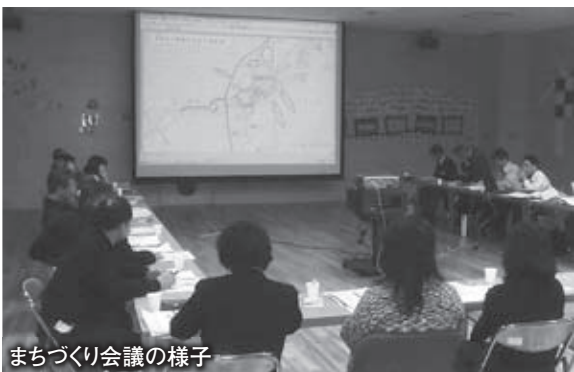
まちづくり会議の様子

◆プランの実現に向けて 住民と市のパートナーシップ によるまちづくり 「日高地区まちづくり会議」は、住民参加の機会の創出やまちづくり団体の地域活動の支援に努め、より多くの住民がまちづくりに関わっていく「住民参加」のまちづくりを進めます。 今後の日高地区のまちづくりは、「日高地区まちづくり会議」を中核として、日高地区区長会などと連携を図りながらまちづくりを進めます。