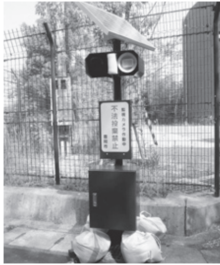
▲不法投棄監視カメラ