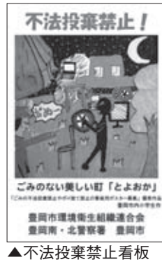
▲不法投棄禁止看板

市では、豊岡市環境衛生組織連合会と協力して、ごみの不法投棄禁止やポイ捨て禁止の啓発運動を行っています。その運動の一つとして、不法投棄禁止の看板を作成しました。