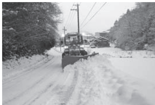
▲幹線道路の除雪をする除雪車

A 昨年度の除雪作業費用は、約3億1千万円でした。市が1日で除雪作業を行う距離は、約700キロメ