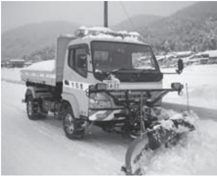
▲幹線道路の除雪をする除雪車

家周辺の雪を道路へ捨てられると、交通の妨げとなり危険です。道路へ雪を捨てないでください。