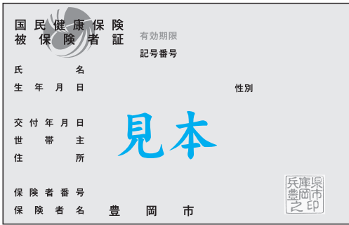
▲カード様式の保険証(表面)

現在使用している保険証の有効期限は、11月30日(水)です。新しい保険証(もえぎ色)は、11月下旬に国民健康保険(国保)加入世帯へ特定記録郵便で送付します。手元に届きましたら、保険証に記載してある住所・氏名・生年月日などを確認するとともに、国保に加入している世帯員全員の保険証があるかを確認ください。なお、国保税を滞納している方には、窓口で交付します。