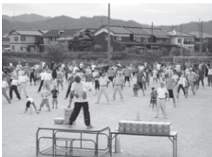
▲八条地区で行われた「みんなでラジオ体操」

ラジオ体操を通じて地域の大人と子どもが顔見知りになることを目的とした「夏休みラジオ体操顔見知り運動」は今年で4年目を迎えました。今夏も、「豊岡市青少年健全育成協議連絡会」と「豊岡市子どもと心でつながる市民運動推進協議会」が中心となって、区長会や学校などの協力を得て市内全域で実施されました。1カ所に集まった区民総出の一斉ラジオ体操は、昨年の6カ所から8カ所(八条・三江・田鶴野・新田・中筋・西気・福住地区、静修校区)に増えました。