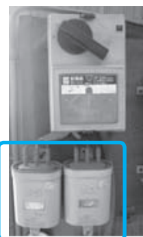
▲低圧進相コンデンサ

精米機や乾燥機を使用する農家の作業場、業務用冷蔵庫、モーター機器などを使用する店舗、作業場、工場などの動力200ボルト用配電盤に取り付けられています。動力200ボルト電力を使用している方は、電気工事店に確認し、取り換え(有料)ください。