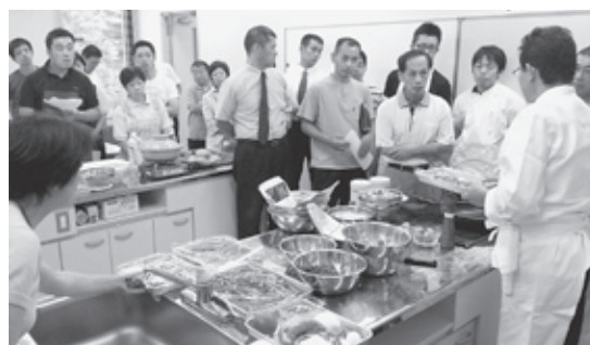
▲城崎地区公民館で行われた「ジビエ料理の第一人者から学ぶ会」の様子(7月14日)

シェフを講師として招き、7月14日に市内飲食店の料理人を対象としたジビエ料理実習を、7月15日に城崎温泉街の旅館料理人を対象とした試食会を開催しました。