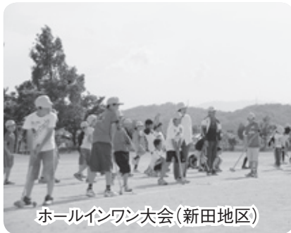
ホールインワン大会(新田地区)