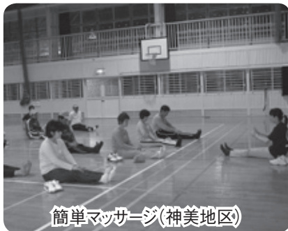
簡単マッサージ(神美地区)