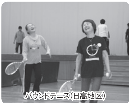
バウンドテニス(日高地区)