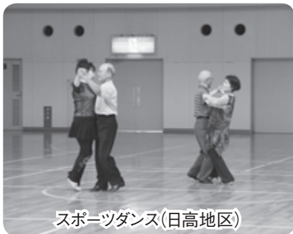
スポーツダンス(日高地区)