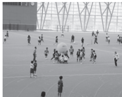
キンボール(県立但馬ドーム)