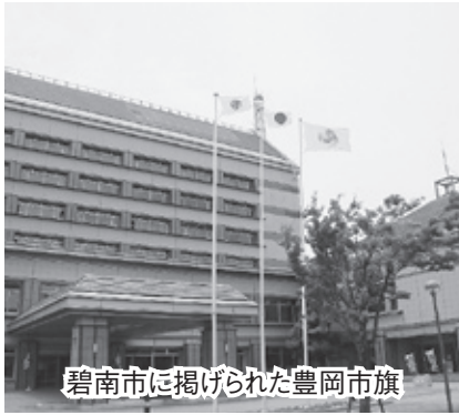
碧南市に掲げられた豊岡市旗

今年は「チャレンジ60」と題し、参加率60パーセントを目指して、市民一丸となり取り組みました。そして、念願の初勝利!!