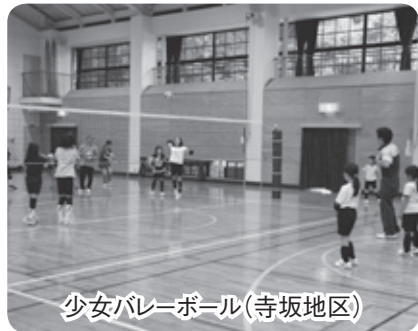
少女バレーボール(寺坂地区)