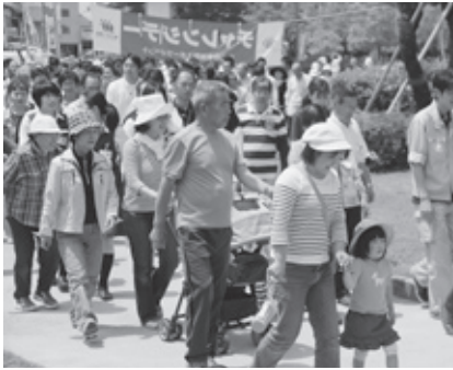
中央イベント・ウォーキング(総合体育館前)