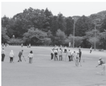
グラウンドゴルフ(植村直己記念スポーツ公園)