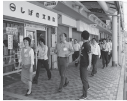
ウォーキング(市役所前)