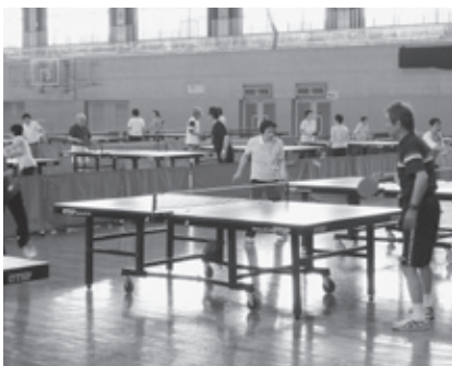
ラージボール卓球(総合体育館)

日高町野区では、健康推進地区活動と野の花サロン活動として、野区公民館でラジオ体操や健康づくりのための話、予防体操などが行われました。手軽で楽しい体操に、参加者の笑い声ははじけていました。