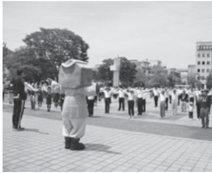
中央イベント・ラジオ体操(総合体育館前)