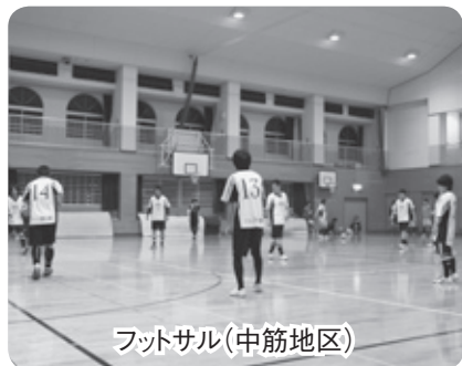
フットサル(中筋地区)