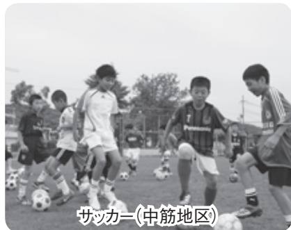
サッカー(中筋地区)