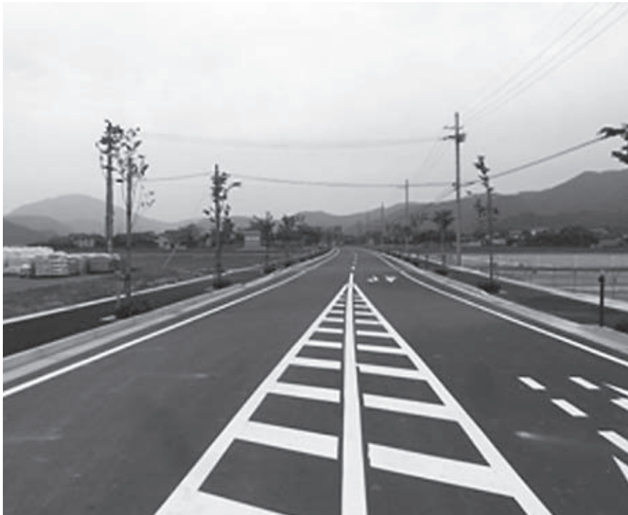
▲平成22年に開通した大開一日市線