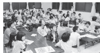
▲南日本海子どもラムサール湿地交流会(豊岡で中海・宍道湖の子どもたちと交流)