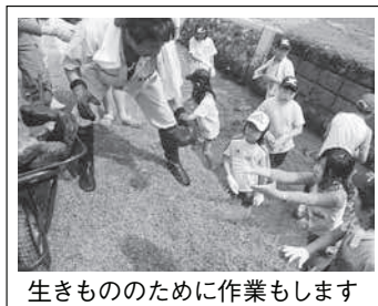
生きもののために作業もします