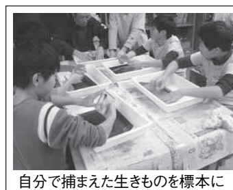
自分で捕まえた生きものを標本に