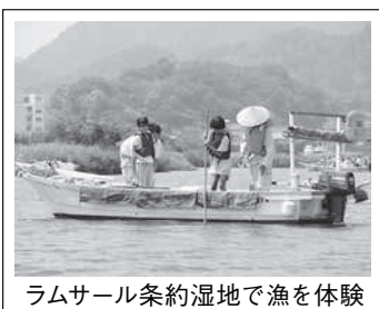
ラムサール条約湿地で漁を体験