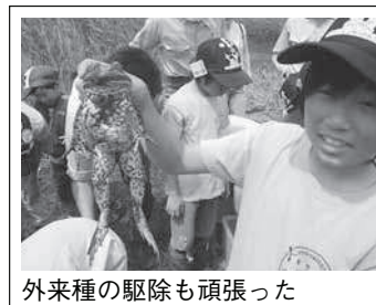
外来種の駆除も頑張った