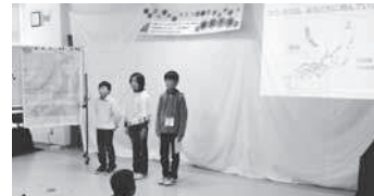
▲KODOMOラムサール〔藤前干潟(名古屋市)で全国の子どもたちと交流〕