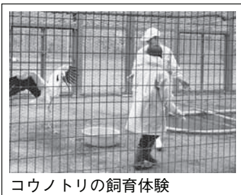
コウノトリの飼育体験