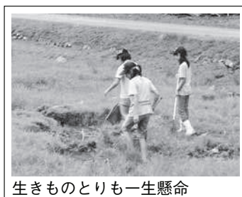
生きものとりも一生懸命