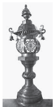
◀才兵衛寄進の燈籠