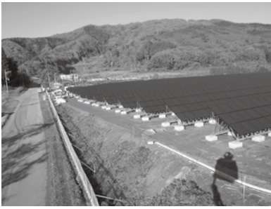
▲山宮地場ソーラー