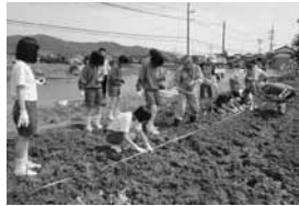
▲ヒマワリの苗を植える生徒

に喜んでもらうとうれしいです。 また、地域の一人暮らしのおじいちゃん、おばあちゃんに手書きの招待状を送り、体育祭に参加していただき、交流を深めています。 今回初めて、阪神・淡路大震災の復興シンボル「はるかのかのひまわり」の苗を学校で育て、37の区で植付けをしました。とても見事な花が咲きました。 エコキャップ運動では、校内に回収箱を設置してペットボトルキャップを回収し、集めたものを関係団体に送り、ワケチン購入に役立ててもらいます。そのほかにも、「あいさつ運動」や「1分前着席」などに取り組み、習慣化しています。 日高東中学校は、行事ごとに、生徒会だけでなく、3年生が中心となってリーダーシップを発揮し、全体をうまくまとめられます。こうした良い伝統を後輩たちにも受け継いでいってほしいです。