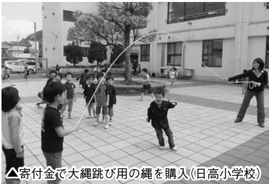
△寄付金で大縄跳び用の縄を購入(日高小学校)

小・中学校などへの寄付を希望する方は、12月28日まで健康増進課、各総合支所市民福祉課、または参加申込書を提出した学校などに実践手帳を添えて申請すると、本年