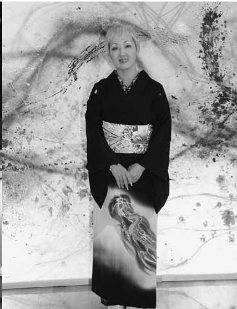
ライブで描いた「昨日の月」の前で