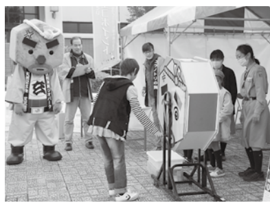
▲抽選会には「玄さん」が駆け付け、参加者を応援