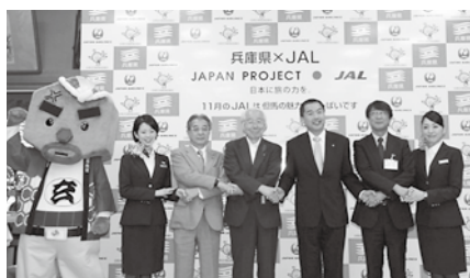
▲共同記者会見には、JAL、県、市関係者が出席