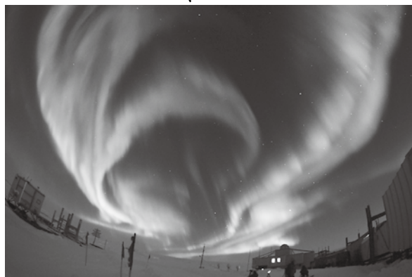
▲感動的なオーロラ

これまで多くのオーロラを見てきましたが、最後のオーロラ観察(10月14日)で、今までにない一番色付いたオーロラを見ることができました。こんな感動的なオーロラはめつたにないそうです。良い思い出になりました。