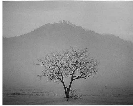
▲幻想的な但馬富士(三開山)

景観は、基盤となる「地理的、自然的要素」と、人々がその中で暮らし築いてきた歴史や伝統、文化、生業などの「生活的要素」が、密接に関わりながら重層的に形づくられるものです。このことを「豊岡、風景のものがたり」として捉え、私たちの記憶に残る豊岡らしい風景を、みんなの資産として大切に守り育てる