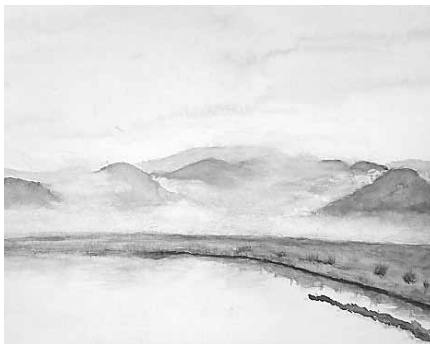
▲円山川の朝霧に幾重にも重なる山並み

校歌の中には、学校の歴史、校訓などとともに、山や川、田園など、地域が大切にしている多くの風景が盛り込まれています。校歌を歌うことで、普段見る山や川が特別なものとなり、地域自慢の風景であるというのを再認識できます。校歌に謳われている山や川などの風景は、人々の子どもたちからの記憶であり、変えてはならない風景です。