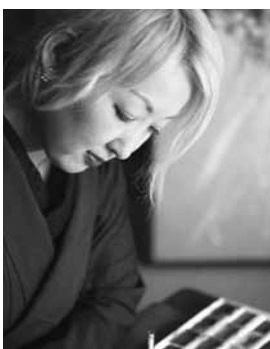
▲趣味はガーデニング

今回の企画展には、ライブで描いた「昨日の月」のほか、因州和紙に描いた「誰そかれ」、新作の屏風「久遠」などを展示。和紙に描いた作品は、ライトで照らされて行灯のように浮かび上がり、幻想的な非日常空間を生み出しています。皆さんも、神秘の世界に足を踏み入れてみませんか。