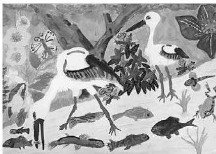
▲多様な生きものが生き生き暮らす風景

豊岡盆地の南端付近から河口までの約16キロメートルは、勾配がほとんどないため低湿地状の土地が多くあります。湿地で餌を採るコウノトリの