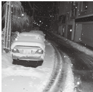
▲除雪作業の妨げとなる路上駐車

路上駐車は除雪作業の妨げとなりますので、絶対に行わないでください。路上駐車がある場合、車両を傷付ける危険性が高いため、その路線の除雪ができなくなります。さらに除雪作業の進行が遅れる原因となり、皆さんの迷惑になります。