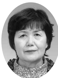
〔任期 平成26年 5月15日まで〕