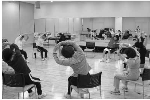
▲円になり、ストレッチをする

運動は何歳から始めても遅くありません。効果を出すためには正しい方法で行うことがポイントです。