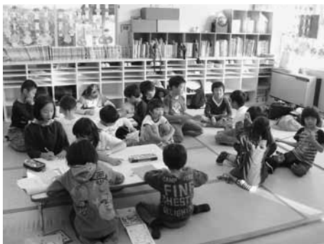
▲放課後児童クラブの様子

1年間を通して利用を希望する方が対象です。育児休業復帰などで、年度途中からの利用を希望する方もこの期間中に申請書を提出してください。詳細を記載したチラシや申込用紙などは、こども育成課、各総合支所地域振興課、および各放課後児童クラブに置いてあります。