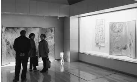
KEIKO*萬桂の世界展の様子