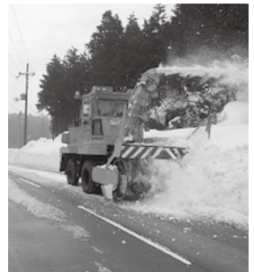
▲幹線道路の除雪をするロータリー車