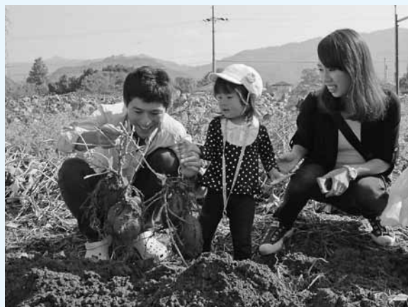
▲サツマイモ掘り体験。「土」の中から出てくる大きなサツマイモに、子どもたちはビックリ

同農園は、貸し農園として整備されましたが、平成16年10月、台風23号の影響で、1メートル以上浸水。この祭りは、その復興に協力してくれた方々に感謝するとともに、復興した区民の元気の発信や収穫への感謝などを込めて、平成19年から毎年開催されています。参加者は、バンド演奏や餅つき、収穫体験などを楽しみながら、地元で収穫されたお米やゴボウ、サトイモなどを使った炊き込みご飯などをおいしそうにほおばっていました。