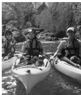
▲ジオカヌーを楽しむツアー参加者

10月のツアーには6組13人が参加。ガイドの案内のもと、コウノトリ文化館、城下町出石やハチゴロウの戸島湿地を