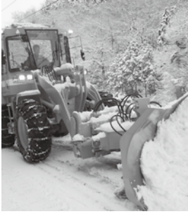
▲幹線道路の除雪をする除雪車