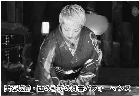
出石城跡・西の郭での舞書パフォーマンス