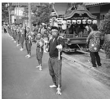
▲太刀振り(但東町赤野)

まざまな伝統行事が多く残っており、先人から引き継がれ現在もなお地域の生活の一部となっているものも多くあります。本市の祭りは、特産「杞柳・かばん産業」の守護神である柳の宮のまつり、城崎温泉のだんじり祭り、江戸時代の参勤交代の様子を伝える出石お城まつりなどが有名です。また、長さ約1・5メートルの大わらじと大ぞうりが神木に神の履物として奉納され、