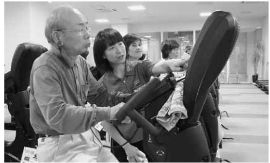
▲筋トレマシン(エアロバイク)を活用