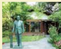
▲太田垣士郎資料館

●発行／豊岡市 ☎079623-1111 FAX23-1124 ●編集／政策調整部秘書広報課