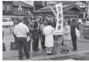
▲交通安全協会による交通事故防止街頭キャンペーン