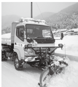
▲幹線道路の除雪をする除雪車

A 迷惑をお掛けする場合がありますが、道路交通の確保を最優先に除雪作業を行っておりますので、理解をお願いします。