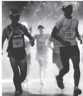
▲推薦作品「私は、まだまだ元気です」