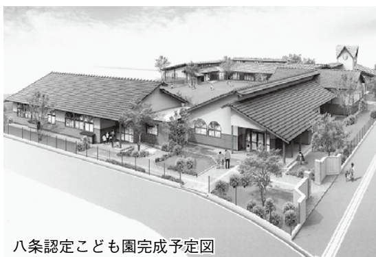
八条認定こども園完成予定図

市では、より良い就学前(小学校入学まで)の教育・保育を目指して、「豊岡市における幼稚園・保育所のあり方」計画に基づき、平成25年4月から「八条認定こども園」「港認定こども園」を開園します。 また、平成25年4月から五荘幼稚園と奈佐幼稚園を再編し、4・5歳児の2年保育を開始します。 さらに、豊岡めぐみ、豊岡ひかり、田鶴野、新田、中筋、神美幼稚園でも、4・5歳児の2年保育を開始します。 《問合せ》こども企画課こども企画係 ☎21-9003