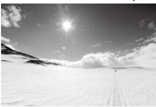
▲内陸 晴れても気温はマイナス30度

今回はドームふじに向かう旅行用の大型雪上車やソリを氷の中から掘り出し、一部を昭和基地まで回送する業務でした。頭上は青空でも地上はマイナス30度、風速10メートルの地吹雪。一時視界が20メートルまで落ちるなど停滞を余儀なくされ、直線で約20キロメートルを片道8時間かけて移動し