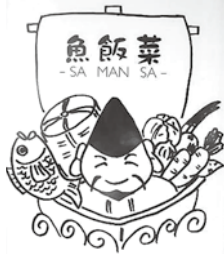
▲お店のロゴマーク

「ご飯(お米)を仲立ちに、海・山・畑の幸をつなぐお店にしたい」という思いから、このネーミングにたどり着きました。豊岡の農業の特徴は、生き物のつながり、「循環」にあると思います。それを店でも表現できないかと。店のシンボルキャラクターも宝(田からのもの)を船に満載したエビスさんです。