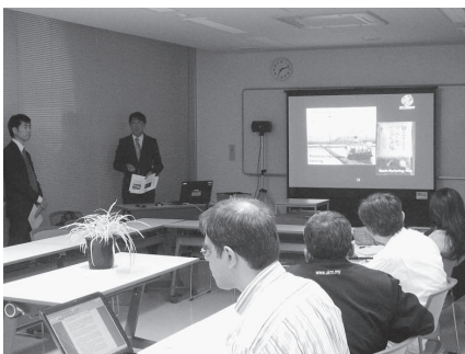
APGN委員会でプレゼンする中貝市長

アジア太平洋地域の世界ジオパークで構成する「アジア太平洋ジオパークネットワーク（APGN）」の第4回シンポジウムが、平成27年に山陰