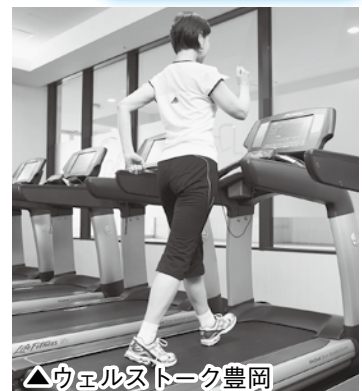
△ウエルストーク豊岡