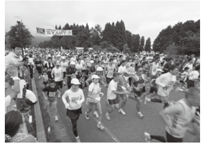
▲昨年の大会の様子