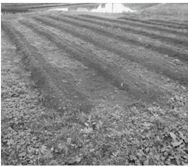
▲堆肥を散布した畑

発酵分解の際に60度以上の熱が発生するので、雑草の種子は死滅します。製造を始めてから2年経ちましたが、雑草は生えていません。