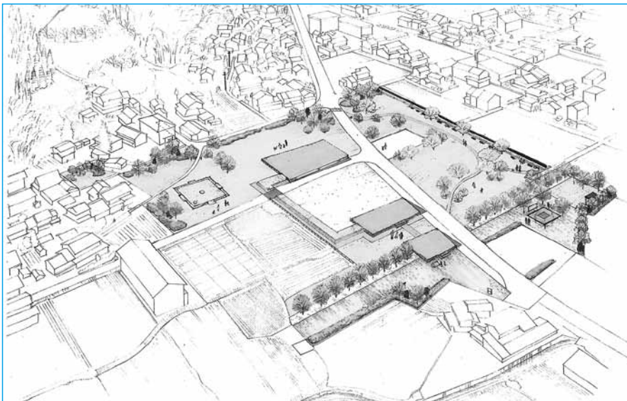
整備イメージ図(作画:小沼康子)

今後、市民や地元関係者の皆さんをはじめ、国や県の意向を聞きながら、より良い整備・活用ができるように事業を具体化していきます。