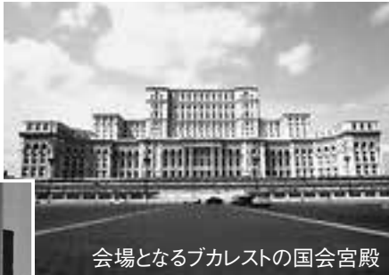
会場となるブカレストの国会宮殿

7月はいよいよラムサール条約湿地登録の月。上旬の第11回締約国会議(COP11)での登録認定を経て、下旬には啓発週間「ラムサールWEEK」でさまざまな行事を実施します。ぜひ、参加してください。 《問合せ》コウノトリ共生課 ☎ 21-9017