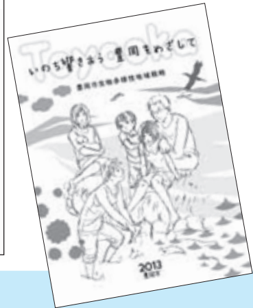
豊岡市生物多様性地域戦略