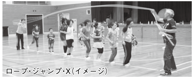
ロープ・ジャンプ・X(イメージ)

●ファミリージョギング(※) (10:30スタート・円山川堤防1kmコース、2kmコース)