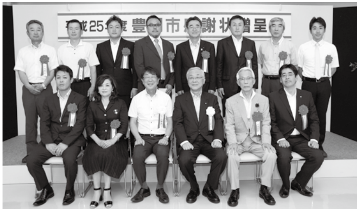
▲贈呈式後の記念撮影