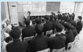
▲学校支援ボランティアの読み聞かせ

今後も、地域ぐるみの学校支援活動が活発化し、学校支援ボランティアの輪が広がるよう、皆さんの温かい支援をお願いします。