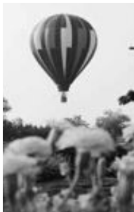
▲熱気球係留体験フライト