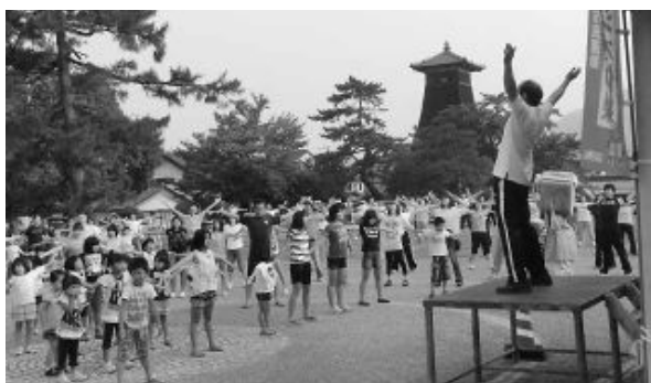
▲弘道小学校区の一斉ラジオ体操(平成24年7月)

昨年は、市内中学生の60パーセントが1回以上参加し、最前列で体操指導をしたり、体操後に地域の方と一緒に清掃活動する姿も見られました。地域の子どもたちとの触れ