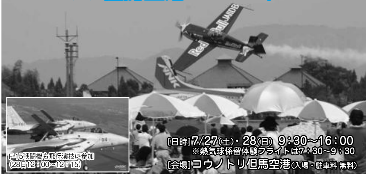
F-15戦闘機も飛行演技に参加 (28日12:00~12:15)

【日時】7/27(土)・28(日) 9:30~16:00 ※熱気球係留体験フライトは7:30~9:30