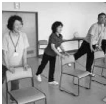
▲ヘルスアップ教室の様子