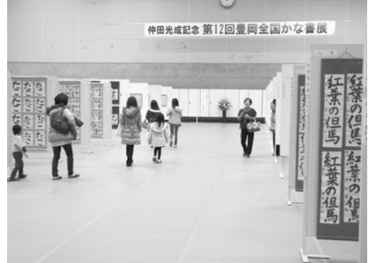
▲第12回展では全国19都府県から5,473点の応募があった