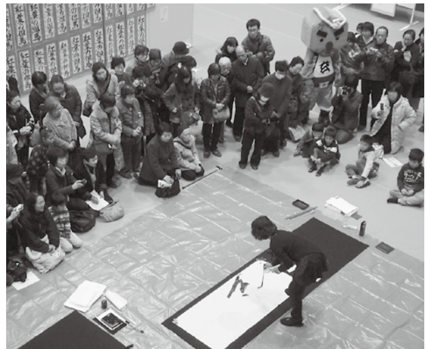
▲第12回展の席上揮毫(書の実演)。審査員4人が近代詩文書やかな書を披露

竹野支所総務係内 「豊岡全国かな書展実行委員会事務局」 ☎47-1111 FAX47-1850