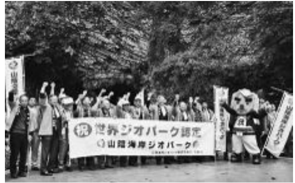
平成22年／10月3日 山陰海岸ジオパークが世界ジオパークに認定