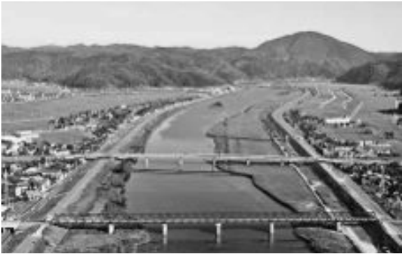
平成24年／7月3日 円山川下流域・周辺水田がラムサール条約登録湿地に