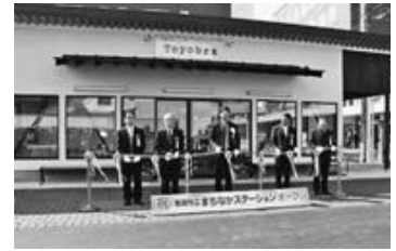
平成26年／3月23日 まちなかステーションがオープン