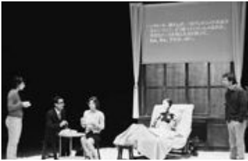
平成26年／4月26日 城崎国際アートセンターがオープン