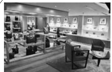
平成26年／4月19日 アルチザンがオープン