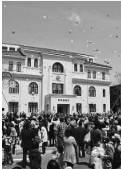
平成26年／4月19日 市役所新庁舎がグランドオープン