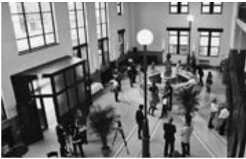
平成26年／4月18日 豊岡1925がオープン