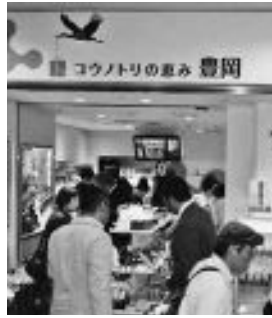
平成23年／7月8日 豊岡市アンテナショップ がオープン