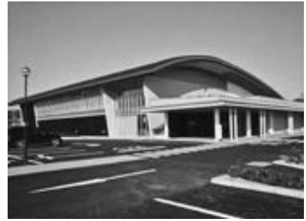
平成22年／4月1日 ウェルストック豊岡がオープン