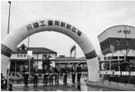
平成24年／3月17日 豊岡駅前広場が完成