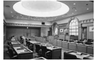
平成25年／8月30日 新議場で議会が開会