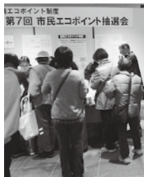
▲どんな商品を選ぶか迷います