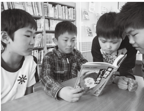
▲寄付金活用事例：図書購入(八条小学校)