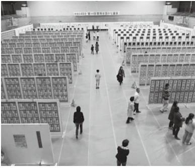
▲ズラリと並んだかな書