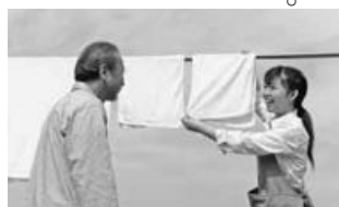
ホームヘルパーによる家事援助

現在、介護保険の「介護予防給付の制度」で実施されている要支援認定者のホームヘルパー（介護予防訪問介護）やデイサービス（介護予防通所介護）を、同じ介護保険の「地域支援事業」で実施することになります。