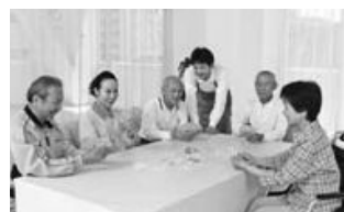
ミニデイサービスのお世話

基準や市からサービス事業者に支払う費用（報酬や委託料の額など）を、市が定めます。その際、専門的な知識や技術を要しないサービスは、大幅に緩やかにした基準や委託料を設定することもできます。例えば「家事援助、見守り、安否確認、配食、日中の集い場でのお世話など」は、地域のボランティアや元氣な高齢者などでも制度の枠組みの中でサービスを提供できます。