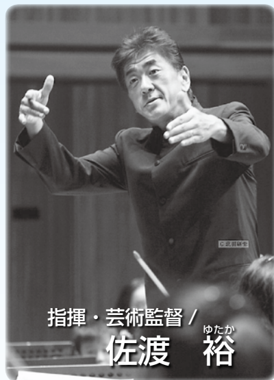
指揮・芸術監督 / 佐渡 裕

日時 9月6日(土)午後1時~(約50分) 場所 ①勝林寺(出石町内町) ②豊岡稽古堂1階 ③御用地館(竹野町竹野) 内容 PACオーケストラによる室内楽のミニコンサート(4~5人編成)