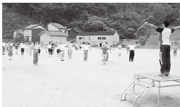
▲城崎小学校区の一斉ラジオ体操(平成25年7月)