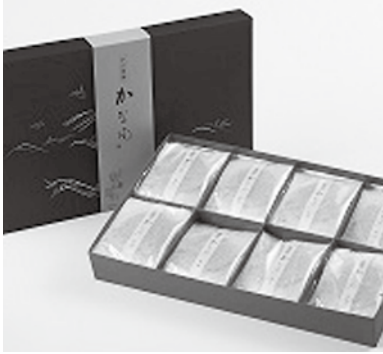
▲熟成二度焼き煎餅「かなめ」

そこで、ロスの少ない餅の製造を始め、おこわ、煎餅と商品のラインナップを広げて現在に至ります。