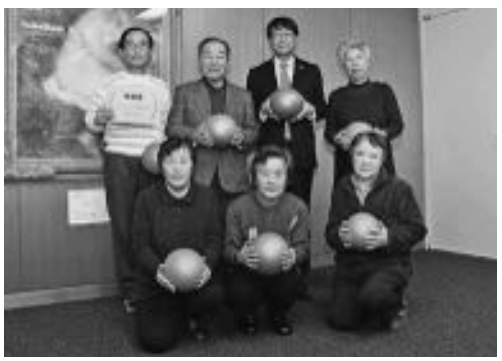
▲岩中区玄さん元気教室参加者の皆さん。みんなと一緒に楽しく続けられる。

「体を動かすのが楽しい！」「同世代より若く見られたい!(笑)」…ムード抜群です！